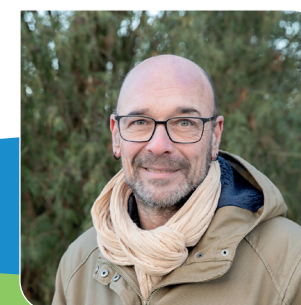
Olivier DESALEUX Photographe Le Bourg