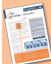
La gazette N°1