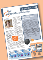
La gazette N°3