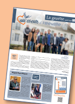
La gazette N°2