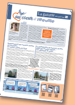
La gazette N°4