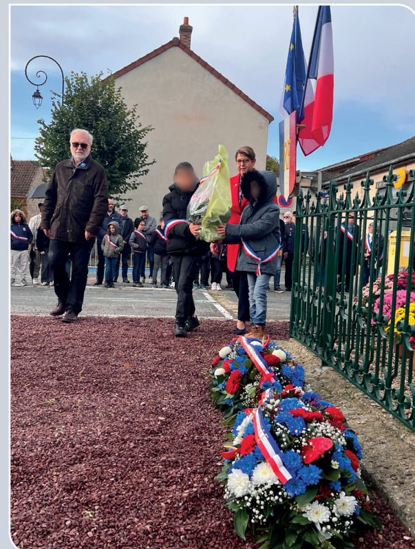
Cérémonie commémorative du 11 novembre 2023.